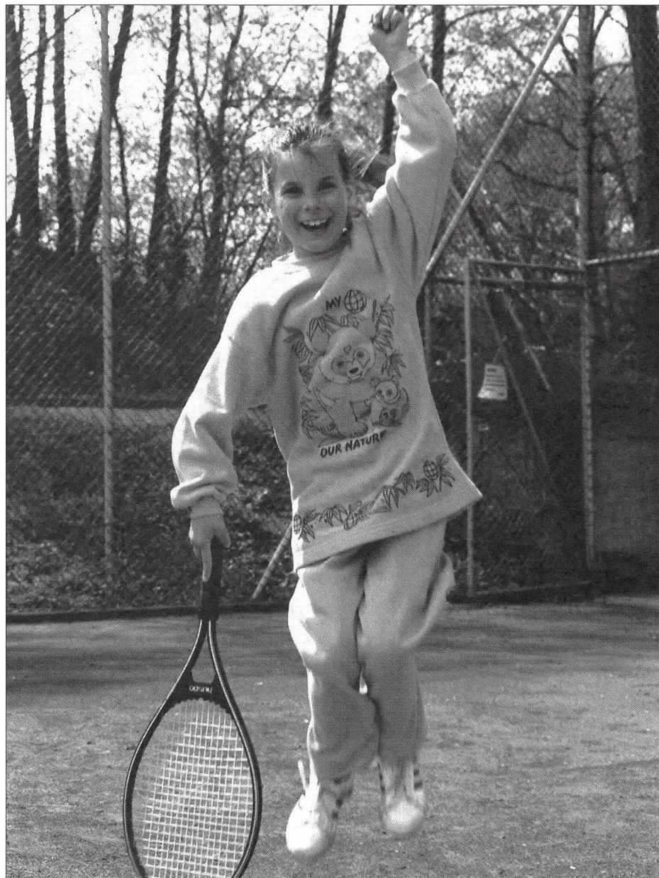
Championne, elle jouera peut-être sur la surface miracle répondant aux nombreuses exigences du tennis!

Il n'existe pratiquement pas de littérature sur les revêtements de sol des installations de tennis si ce n'est sur la technique de la construction. Les joueurs sont pourtant les premiers concernés puisqu'il en va de la qualité du jeu et de leur santé. C'est ce qui a décidé l'auteur d'approfondir le sujet. Il s'est essentiellement basé sur ses expériences et observations personnelles faites au cours de nombreuses années de pratique en tant que joueur, entraîneur diplômé du CNSE et architecte spécialisé dans la construction d'installations sportives. (Ny)