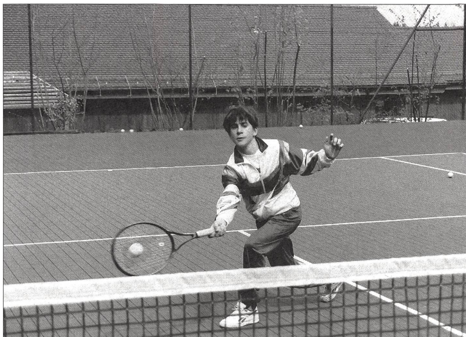
Les surfaces synthétiques ou en dur conviennent particulièrement bien aux joueurs d'attaque. Sur ce type de surfaces, les articulations du joueur sont plus sollicitées que lorsqu'il évolue sur la terre battue.

pellation de «terrains stabilisés mécaniquement». Il s'agit de la surface la plus répandue en Europe, malgré les problèmes et l'ampleur de l'entretien qu'elle suppose. Il existe plusieurs variétés de terre battue: la plus courante en Suisse et en France est à base de calcaire, la plus courante en Allemagne, en Autriche et en Italie à base de schiste rouge. Une terre battue moins gélive, constituée de sable de roche de couleur verte a, elle aussi, fait ses preuves.