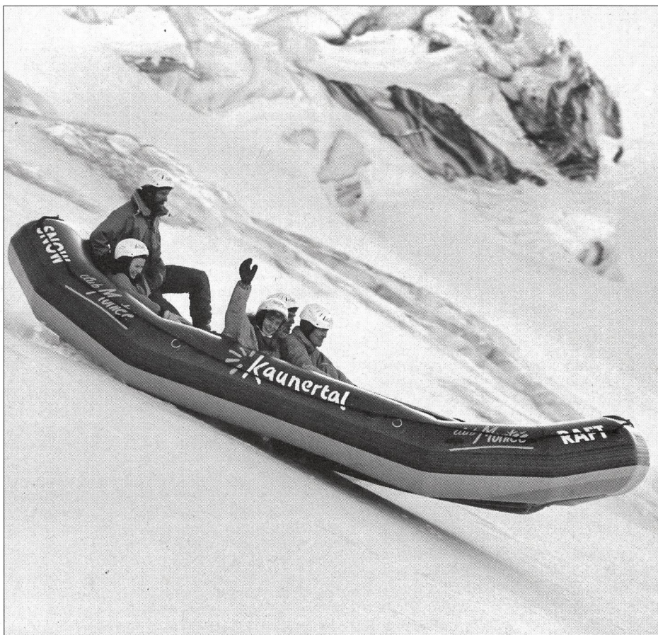
Une folle descente en canot pneumatique sur des pentes enneigées spécialement aménagées pour garantir des sensations fortes.

En Allemagne et en France, certains propriétaires de voiture, la police et les autorités judiciaires se virent confrontés à un problème tout à fait nouveau: le vol de voitures d'un modèle relativement récent, retrouvées en général à peu de distance contre un arbre ou contre le pilier d'un pont après une collision provoquée par le «chauffeur» lui-même. Le voile sur ce mystère fut levé après l'arrestation de l'un des voleurs: l'«airbaging», c'est le nouveau sport que pratiquent les jeunes, lorsque le surf sur les rails du métro, le bungee-jumping et autres jeux dangereux sont passés de mode ou deviennent ennuyeux. Les ados dirigent la voiture volée sur l'obstacle choisi et «testent» les effets de l'airbag au moment de la collision.