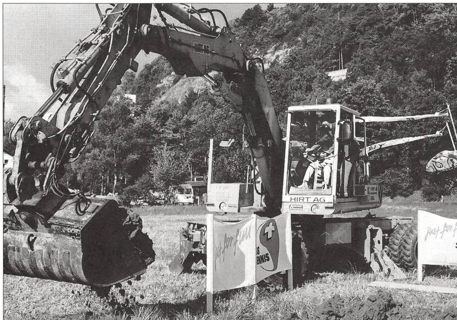
C'est parti! Le premier coup de pelle mécanique a été donné le 7 septembre 1996.

Frédy Léchet, section des installations sportives de l'EFSM