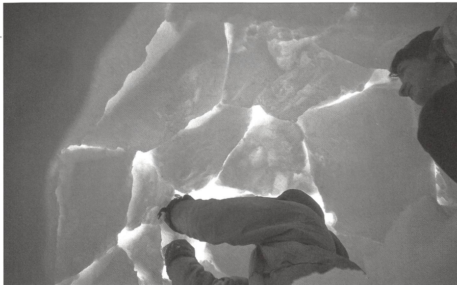
Les derniers blocs sont posés depuis l'intérieur.