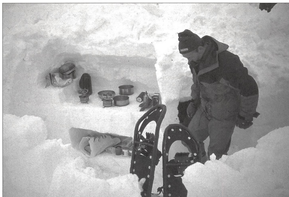
La cuisine est à l'extérieur de l'iglou.