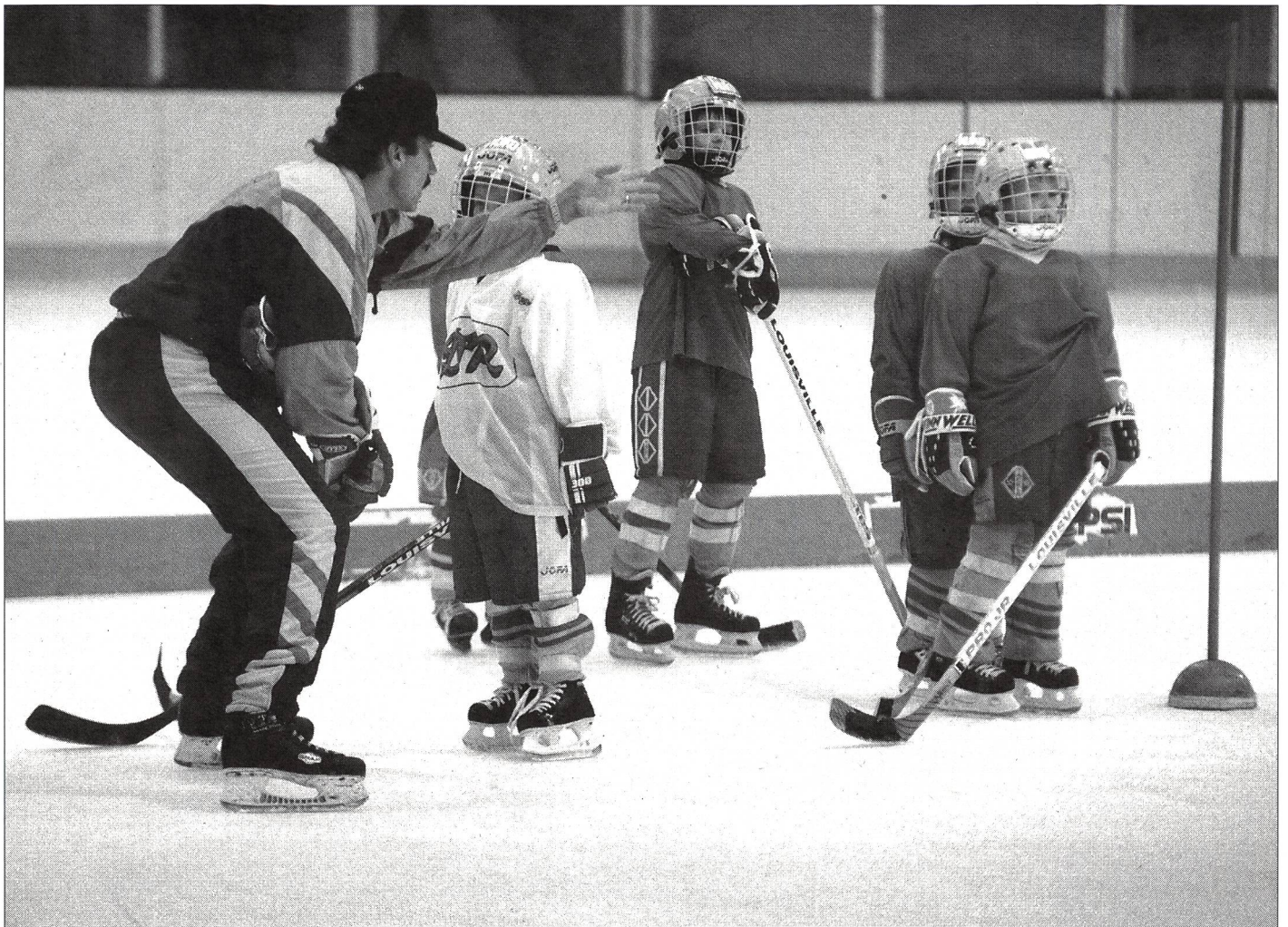
L'introduction au jeu!

contenu doit s'inspirer de situations de jeu réelles et toujours rester fidèle à l'esprit du jeu. Les techniques sont enseignées en vue de donner aux élèves les moyens de résoudre les tâches auxquelles ils sont confrontés dans une situation donnée. Les tâches peuvent également être organisées de manière à permettre aux joueurs de trouver les solutions par eux-mêmes. Grâce à l'analyse collective faite à l'issue de la première phase de jeu, les joueurs acceptent plus volontiers de s'atteler aux tâches qui leur sont proposées, celles-ci prenant valeur de défis.