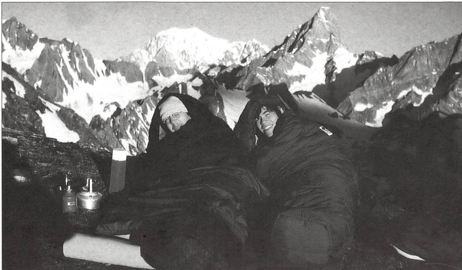
... Goûter au charme particulier du bivouac.

ils se montrent à leur tour plus enthousiastes et plus tolérants à l'égard des responsables, c'est pourquoi ceux-ci veilleront à les faire participer à toutes les décisions, y compris celles qui n'ont pas été planifiées et qui surgissent en cours de route (par exemple: modifier les horaires, changer d'itinéraire, interrompre une randonnée plus tôt que prévu).