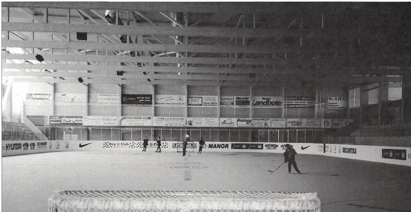
Patinoire couverte du centre sportif «Aaretal», à Oberwischtrach (BE).

triple, ils se situent aux alentours de 7,5 millions de francs, ce qui est légèrement supérieur à ce que prévoit la brochure de l'EFSM 1 qui recommande un plafond de 6 millions de francs. Les points suivants contribuent à expliquer ce surplus d'investissements: