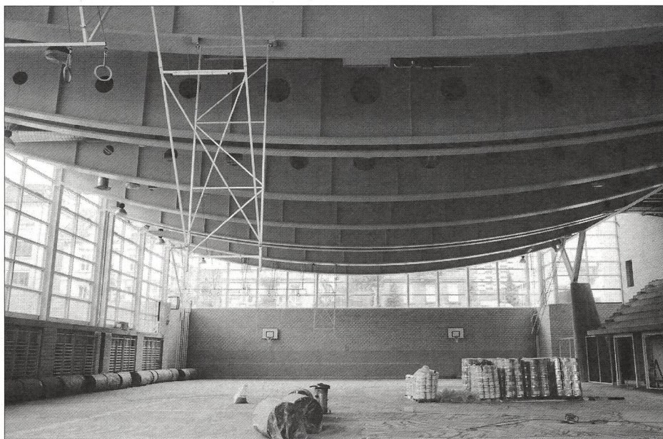
Double salle triple de l'Ecole professionnelle, des arts et métiers de Bienne (BE) en pleine construction.

Le complexe vient d'être inauguré. Sa conception est due au bureau d'architectes bernois Tschumi + Benoit SA, le même qui, il y a un certain nombre d'années déjà, avait construit l'Ecole elle-même. Quant aux coûts, calculés pour une salle