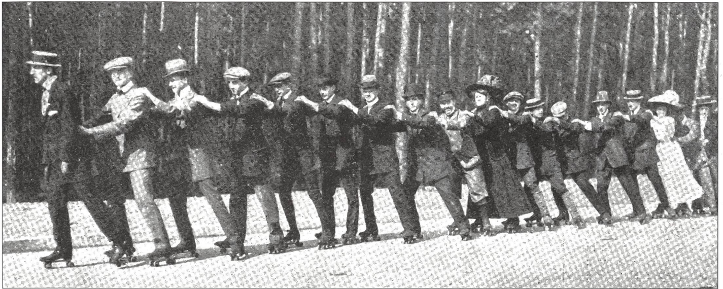
Sur le chemin du retour: la chenille roulante. Berlin, 1909.