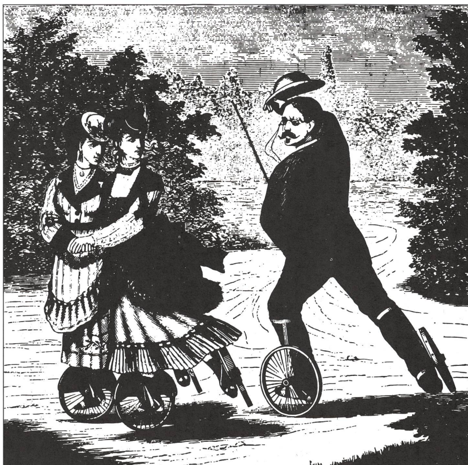
Promenade sur patins monoroues. Gravure sur bois, anonyme, XIX e siècle.

Bien que la direction de la branche ait changé entre-temps, la commission de la branche a réussi à achever, en juillet 1997, les travaux consacrés aux manuels