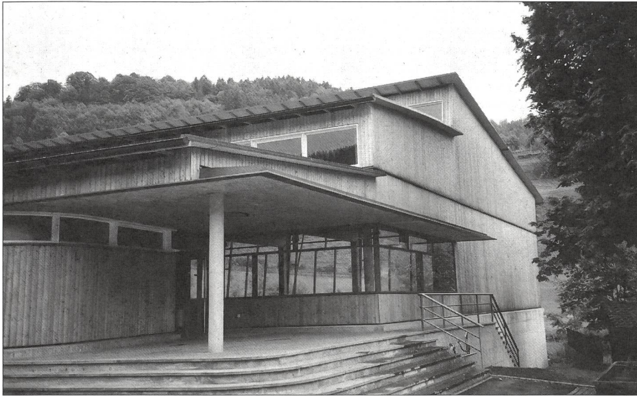
Double salle de sport de Bühler (AR). Concours d'architecture 1993.