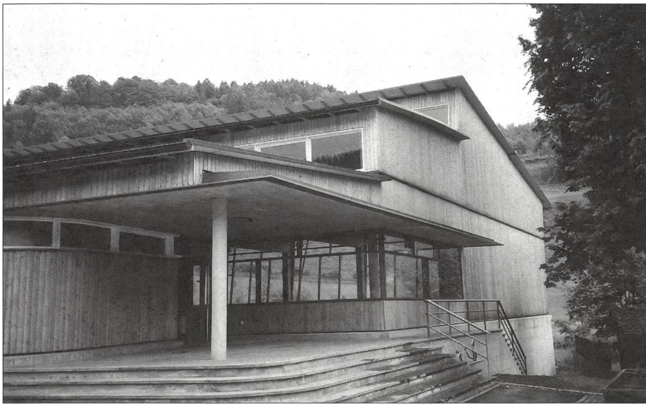
Double salle de sport de Bühler (AR). Concours d'architecture 1993.