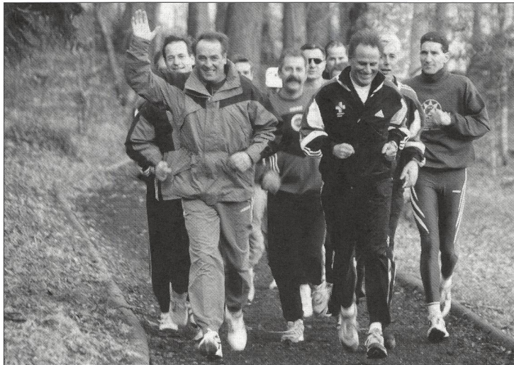
Lors de sa visite à l'EFSM, Adolf Ogi, nouveau Ministre des sports, a donné le tempo.