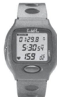
POLAR Accurex Plus™