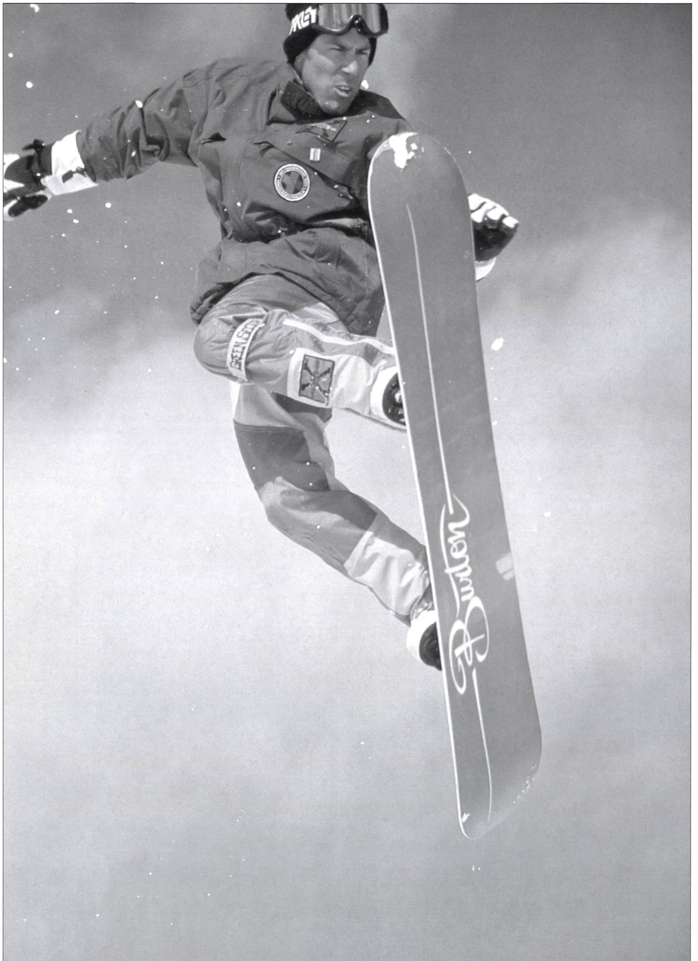
Le snowboard, un sport qui demande beaucoup de souplesse.