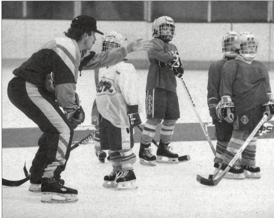
Nous devons agir: la direction reste à définir...