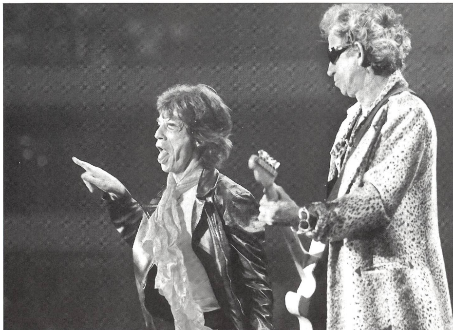
Les Rolling Stones, «papys du rock», ont toujours la cote auprès des jeunes.