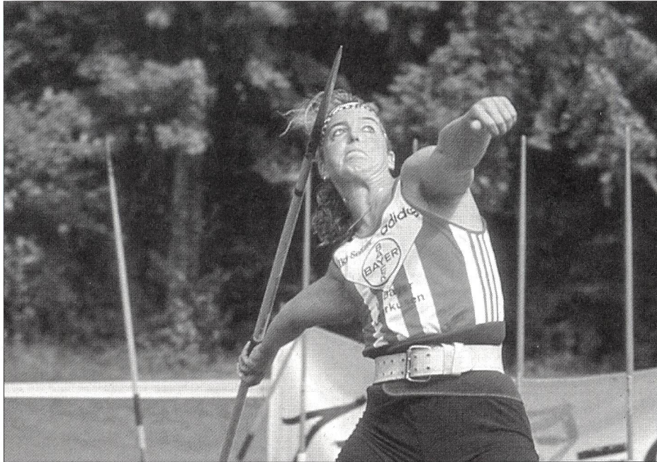
Qu'est-ce que fera Steffi Nerius après le sport?