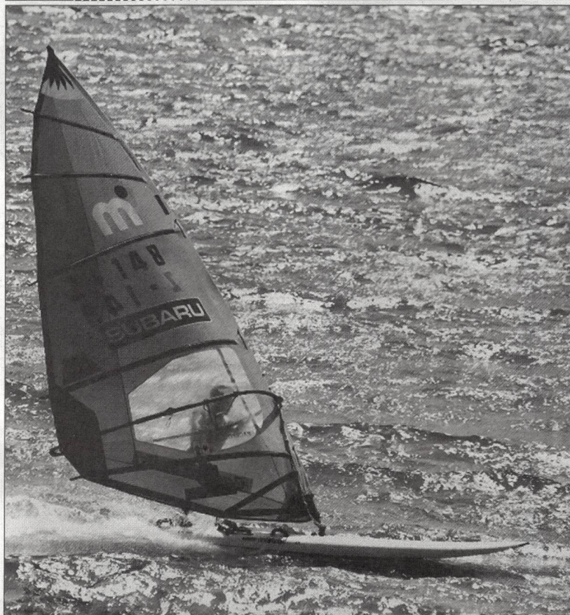
Revue mensuelle de l'EFSM et de Jeunesse+Sport

ment, au nom de la rédaction, tous ceux qui ont bien voulu remplir et renvoyer le questionnaire. ■