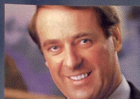
Adolf Ogi, conseiller fédéral

L'éducation vise le développement de l'être humain dans sa globalité. Le sport – dans le cadre de l'école ou en dehors de celle-ci – doit y contribuer.