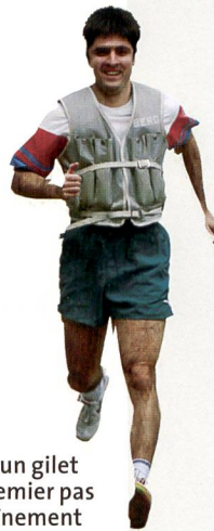
Courir avec un gilet lesté: un premier pas vers l'entraînement intégratif.