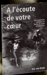
A l'écoute de votre cœur (1997) Fr. 19.80/17.80