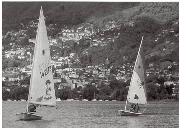
La voile est un sport particulièrement prisé.