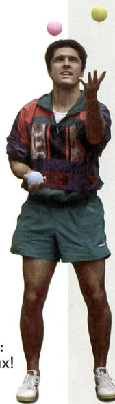
Jongler avec les trois leçons d'EP: un jeu dangereux!