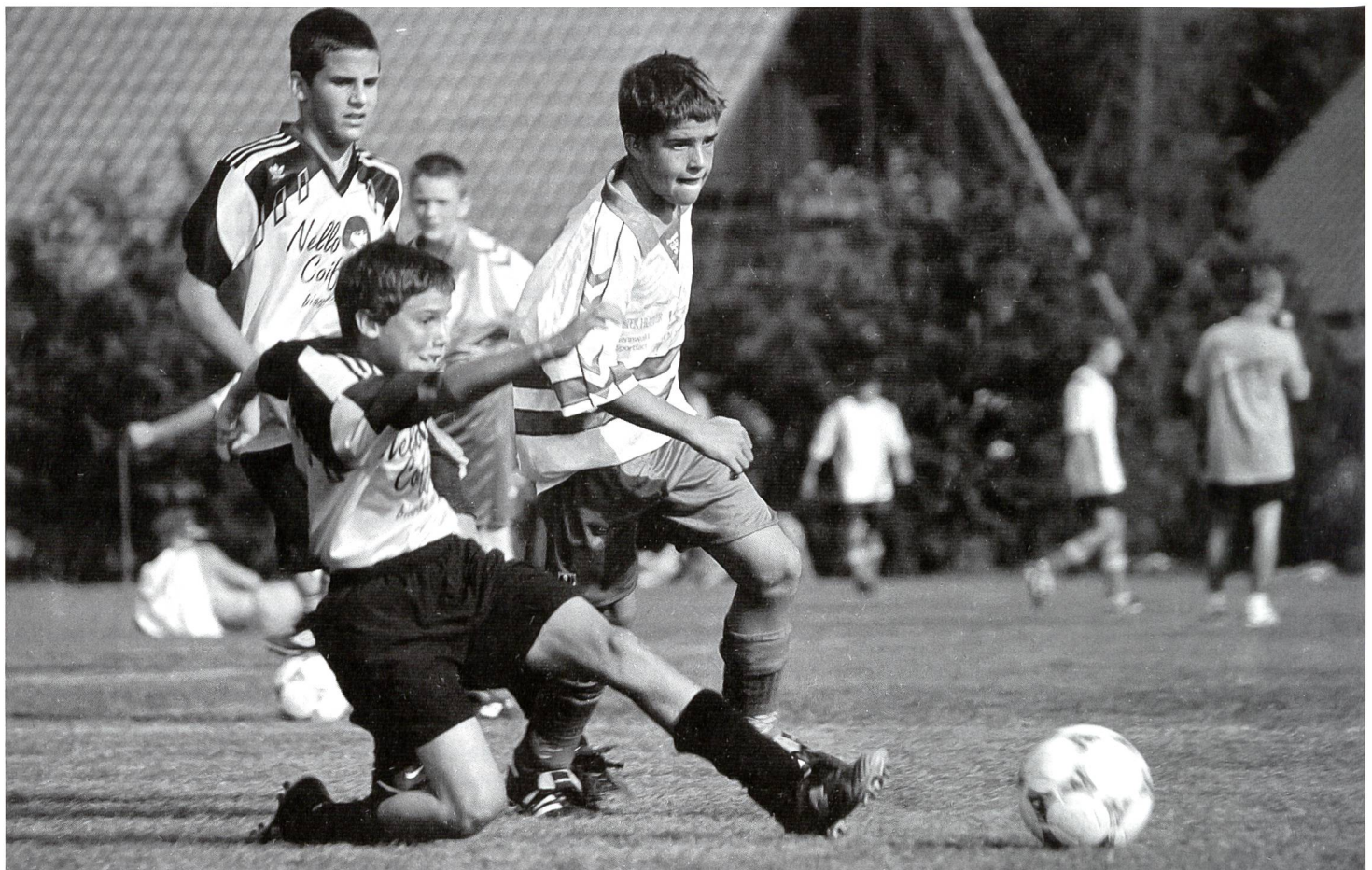
Chez ces jeunes de cet âge, l'accent est d'avantage mis sur la formation technique.

Les accents tactiques évoluent par conséquent avec l'âge. Pour les enfants de 6 à 10 ans, on ne parle pas encore, et c'est voulu, de tactique. Dans cette tranche d'âge, priorité est donnée au jeu ainsi qu'aux aspects relatifs aux qualités de coordination et aux qualités cognitives. Dans la tranche d'âge suivante qui va de 10 à 14 ans, on se concentre très nettement sur la formation technique en veillant toutefois à ce que l'acquisition, la stabilisation et l'application de la technique s'opèrent dans des situations de base tactiques correspondantes. Au niveau des jeunes espoirs, la formation tactique est l'élément auquel il convient d'accorder le plus d'importance si l'on veut assurer aux intéressés une bonne formation générale au jeu.