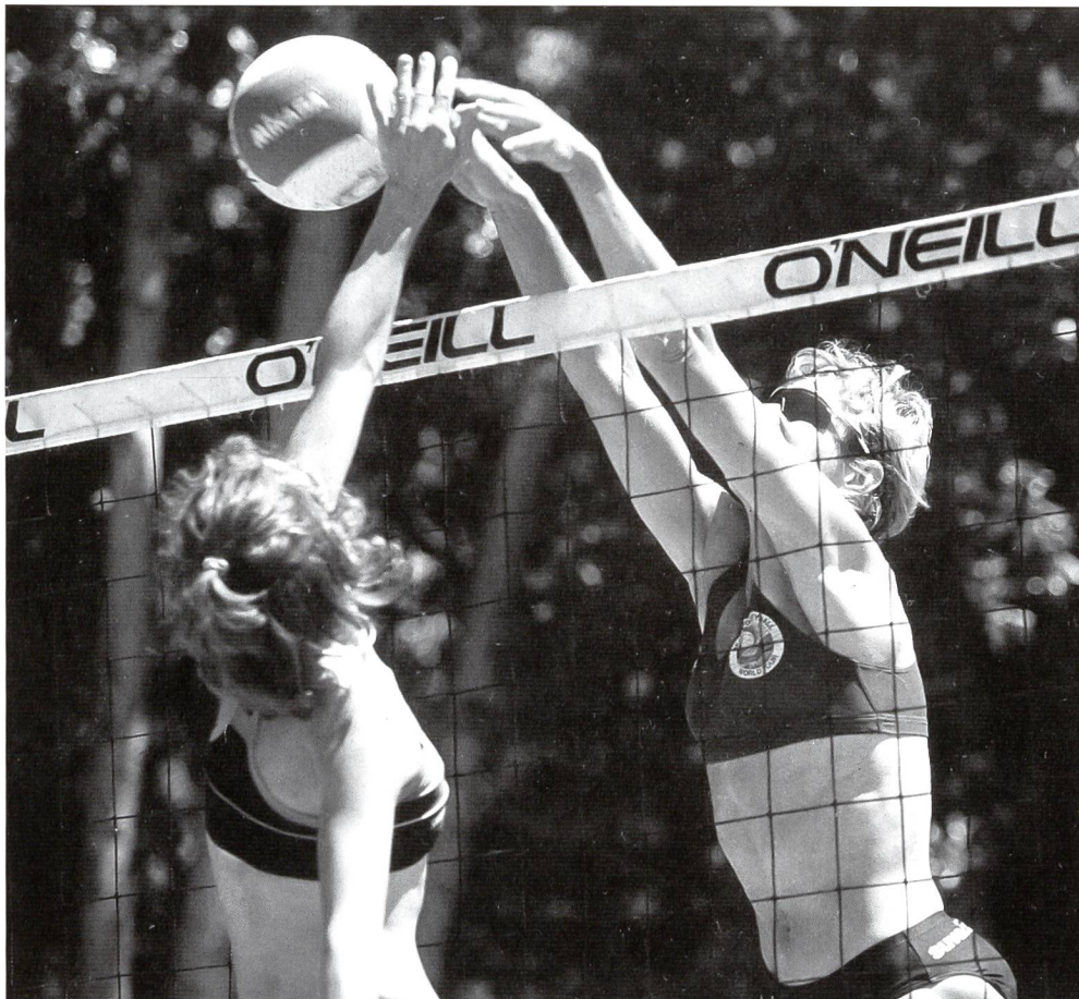
La tactique fait partie intégrante de la formation.