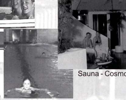
Sauna - Cosmos