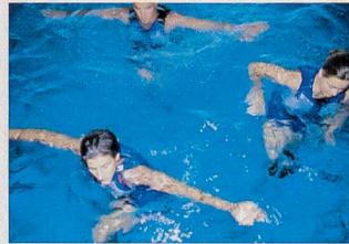
Exercices pour la ceinture scapulaire