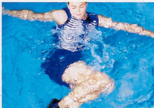
Renforcement de la musculature abdominale, mobilisation de la colonne vertébrale