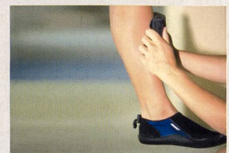
Expérimentation tactile de la résistance de l'eau