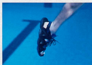
Tendre la cheville durant la phase de traction