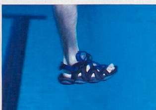
Pied en flexion durant le mouvement vers l'avant