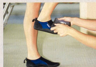
Acquérir la forme du pas hors de l'eau