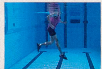
Phase de traction