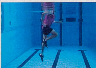
Soulever les genoux, avec flexion simultanée des pieds