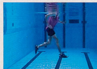
Extension du pied