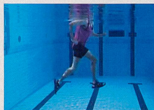
Avancer légèrement la partie inférieure de la jambe