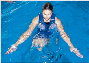
Exercices pour les muscles des groupes musculaires les plus faibles