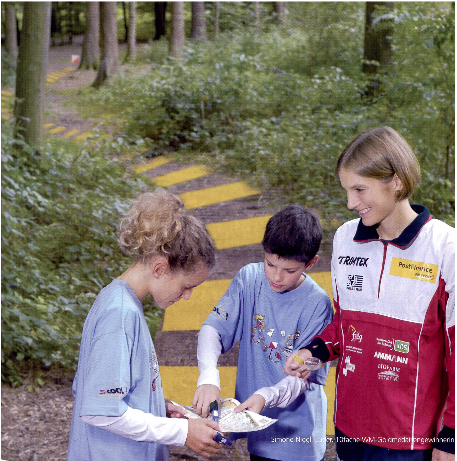
Simone Niggli-Luder, 10fache WM-Goldmedaillengewinnerin