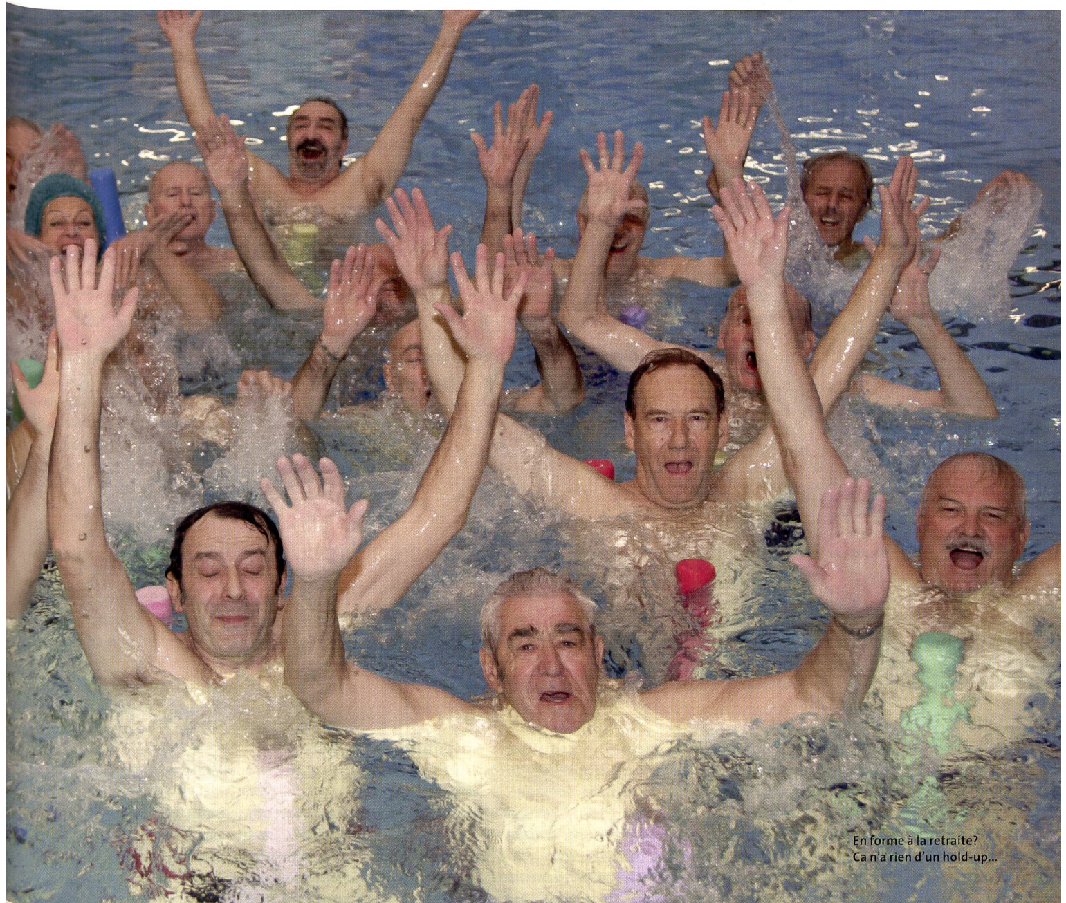
En forme à la retraite? Ca n'a rien d'un hold-up...

un jeune. Les réflexes sont aussi moins rapides. La capacité de performance lors des exercices et des jeux est donc moins grande que celle des jeunes, mais elle permet néanmoins d'atteindre un niveau intéressant.