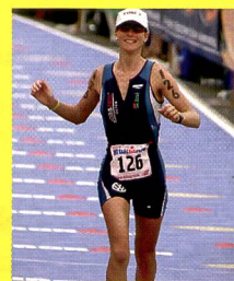
Karin Thürig: Championne Olympique juniore

A l'aide de cet entraînement je peux utiliser efficacement l'entier de mon potentiel.