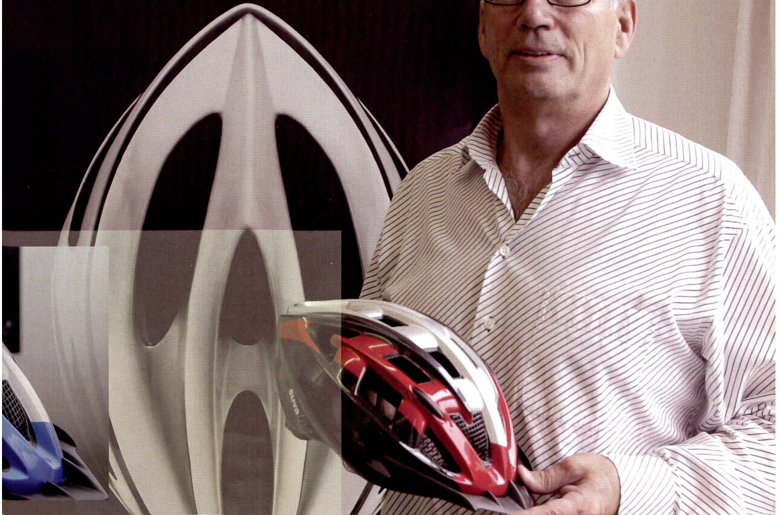
L'affiche récompensée par le Swiss Poster Award 2005.

Le casque? Pour éviter l'horreur intégrale.