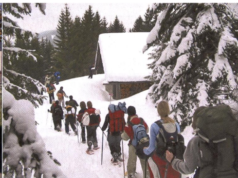
Camps et journées sportives amènent les jeunes à vivre différemment l'éducation physique. Ces activités rythment l'année scolaire et permettent des moments de partage privilégiés.

pensabilité. Avec, comme objectifs de fin de cycle pour chacune des valeurs (dans l'ordre): accepter et appliquer des règles de vie inhérentes à la vie en commun; créer et réaliser de façon indépendante une composition, seul ou en groupe; gérer ses émotions et accepter des situations à risques subjectifs; adhérer à un projet collectif en participant activement à des travaux de groupe; exercer une activité physique extrascolaire hebdomadaire; faire preuve d'une attitude responsable face à des comportements à risques.