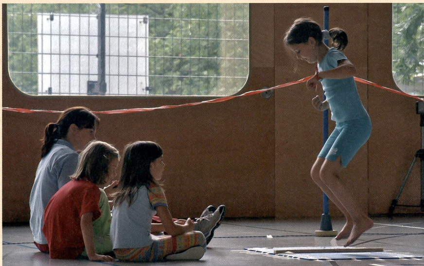
Sauter, c'est rigolo, et ça renforce les os!

Quelles lacunes méthodologiques constatez-vous? On s'aperçoit que les enfants consacrent bien trop peu de temps à l'activité physique pendant les leçons. Cela s'explique, d'une part, par le fait qu'en raison d'une mauvaise organisation, ils passent trop de temps à attendre. Ils doivent par exemple faire la queue devant les installations. D'autre part, seuls les élèves les plus forts – ceux qui ont une activité physique importante pendant leurs loisirs – profitent des sports collectifs, tandis que les moins habiles ne touchent quasiment jamais le ballon. C'est ainsi que le cours d'éducation physique est ressenti comme désagréable, associé à l'expérience de l'exclusion et qu'une certaine aversion pour l'activité physique commence à se développer. Une «pédagogisation à outrance» du cours d'éducation physique s'observe. Les élèves font un beau cercle, l'enseignant veille à ce qu'ils se traitent bien mutuellement, etc. C'est certainement une bonne chose d'un point de vue social et organisationnel. Mais l'étude KISS avait une autre priorité, à savoir la qualité et l'intensité de l'activité physique.