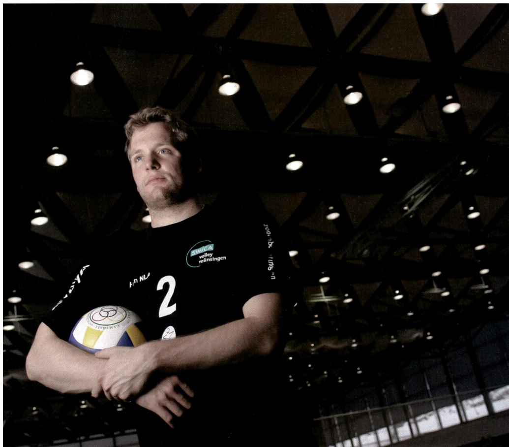
Tricher, un tour de passe-passe inutile.

Lui-même sportif amateur actif et donc «au cœur des événements», Gerhard Walter apprécie la réglementation actuelle en Suisse. Le statut anti-dopage de Swiss Olympic sera aligné sur le code WADA (règlement de l'Agence Mondiale Antidopage) si celui-ci devait être révisé en 2008 ou 2009. «Jusque