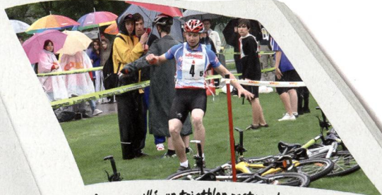
Même mouillé, un triathlon reste un bon triathlon.

manifestations de ce genre ont une grande valeur éducative. Les élèves se rencontrent, rivalisent avec d'autres et ont ainsi la possibilité de vivre des moments en commun aussi bien durant les activités sportives que les loisirs.»