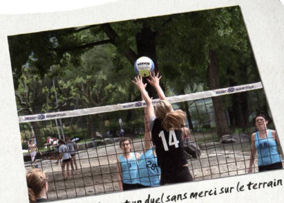
Les élèves se livrent un duel sans merci sur le terrain de beachvolley.