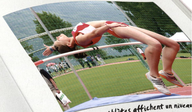
Certaines athlètes affichent un niveau