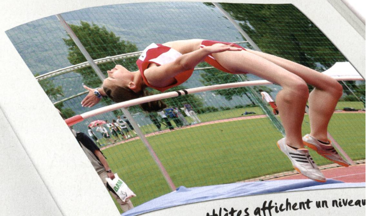
Certaines athlètes affichent un niveau