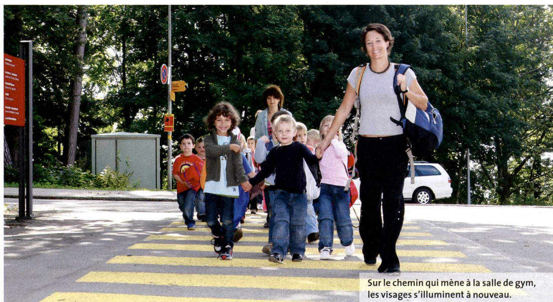
Sur le chemin qui mène à la salle de gym, les visages s'illuminent à nouveau.