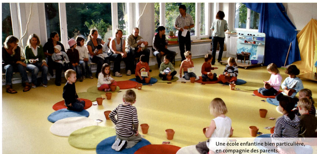
Une école enfantine bien particulière, en compagnie des parents.