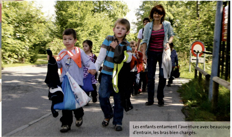
Les enfants entament l'aventure avec beaucoup d'entrain, les bras bien chargés.