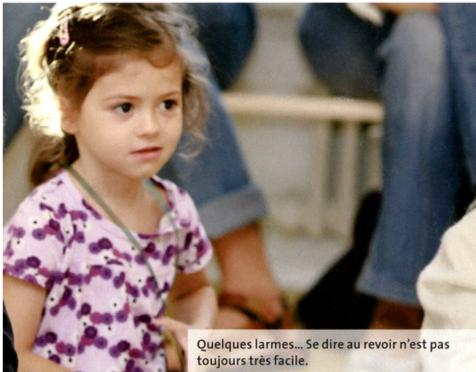
Quelques larmes... Se dire au revoir n'est pas toujours très facile.