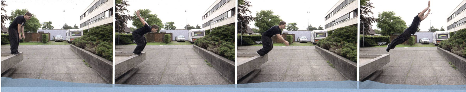
Lors d'un saut de précision, le traceur effectue une réception précise et reste en équilibre sur l'obstacle.

Le Parkour exige une grande mobilité, à l'instar de la gymnastique artistique ou de l'escalade. Le corps doit être en mesure de développer de la force et se stabiliser en cas de tension maximale. Or, le relâchement du tonus musculaire suivant l'étirement peut, selon le groupe de muscles concerné, affecter l'appareil locomoteur et nuire à la performance du traceur.