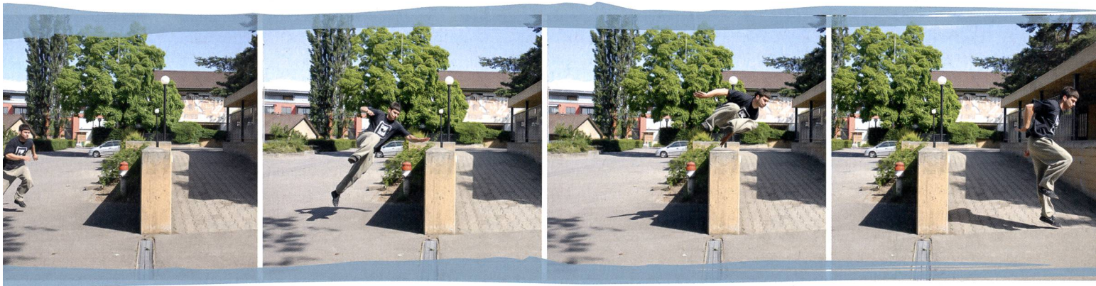
Lors d'un passément rapide, le traceur franchit rapidement un obstacle d'une hauteur de hanches/poitrine.

«mobile» publiera au cours de l'année 2010 un cahier pratique présentant les divers moyens de pratiquer le Parkour à l'école ou dans un club.