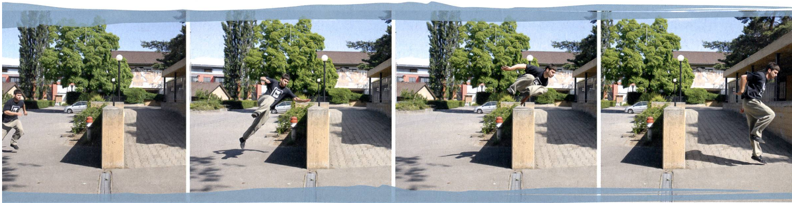
Lors d'un passément rapide, le traceur franchit rapidement un obstacle d'une hauteur de hanches/poitrine.

«mobile» publiera au cours de l'année 2010 un cahier pratique présentant les divers moyens de pratiquer le Parkour à l'école ou dans un club.