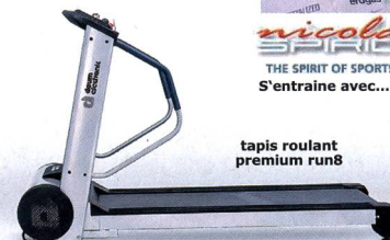
tapis roulant premium run8