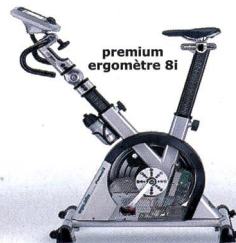
premium ergomètre 8i