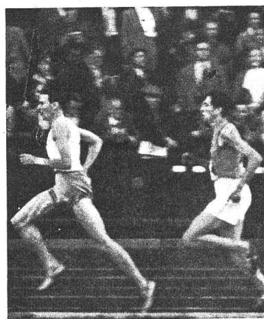
Buonissima tecnica in una finale degli 800 metri piani

Gli esercizi di allenamento (cultura fisica) tendono prima di tutto a ottenere una scioltezza e mobilità completa (ma ancora condotta) del corpo, una certa forza e resistenza del muscolo e a migliorare la coordinazione fra le diverse parti del corpo. Si ottiene per finire uno stato di equilibrio positivo di riposo di tutto l'essere che rappresenta una certa prontezza a reagire, a muoversi. L'atleta in queste condizioni ha la sensazione di una lieve agilità, di