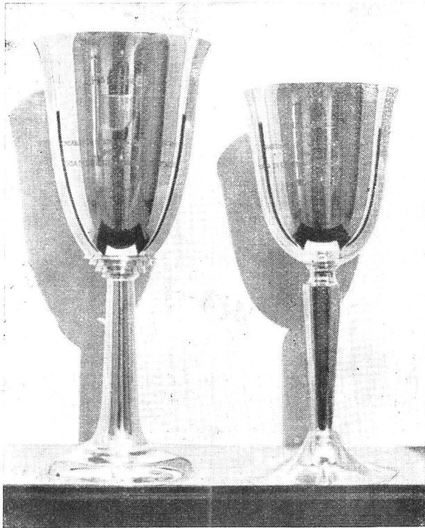
LE COPPE-CHALLENGES IN PALIO: a sinistra quella del Lcd. Consiglio di Stato (categoria A), a destra quella del Dipartimento Militare cantonale (categoria B).