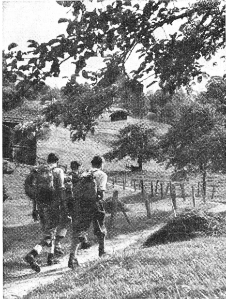
Allegramente: sacco in spalla, e via per monti e valli, fra boschi profumati, per sentieri solitari, alla scoperta del paese!

La nostra epoca è sportiva. Un po' dovunque sorgono stadi, arene e gallerie in cemento armato, e non manca il bar accogliente. Ognuno ha il suo o i suoi sport favoriti. È vero che molti li praticano per procura e seguono semplicemente dalla loro sedia le prodezze dei campioni. Lo sport seduto è il re della nostra epoca. Tante brave persone, che non hanno ancora l'età