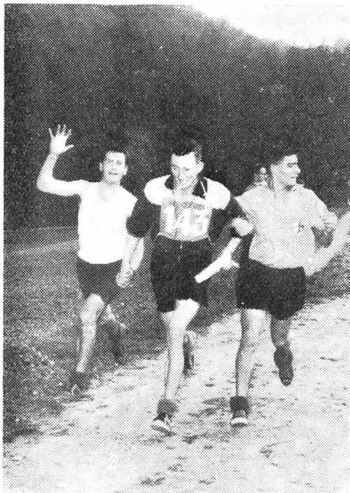
In tutte le corse di orientamento i più forti aiutano i deboli per poter terminare uniti la gara

La nostra corsa, la tanto attesa corsa di orientamento, la corsa più bella che potrebbe da sola riempire per contenuto e validità sportiva tutto il calendario sportivo autunnale, che compendia in certo qual modo l'attività I.P. del Cantone, che chiama a raccolta la gioventù ticinese di ogni luogo e di ogni tendenza sportiva per unirla un giorno in una tenzone che è di tutti, che ha ancora il carattere diamantino del vero sport, che ha ancora la peculiarità (quasi un miracolo) di avere più attori che spettatori, era cresciuta bene come tutte le altre dei passati anni in un clima di passione, di amorosa cura in un piovoso autunno che faceva disperare e invocare il sole. I preparativi procedevano bene, una sola posta era e rimaneva ancora in sospeso e allarmava: il tempo. Noi si scrutava l'orizzonte come aruspici per carpire un segno di speranza, di incoraggiamento. Troppo vivo era il ricordo della corsa tenuta nel Locarnese, sotto scrosci irosi di pioggia, che ci aveva mostrato una gioventù gagliarda, sorridente, entusiasta anche nell'inclemenza del tempo. Una bella dimostrazione come risposta a coloro che nella gioventù vedevano solo il male, che la dipengevano in nero e solo sulla via del facile, della mollezza. Per una volta tanto era qualche cosa di forte, robusto.