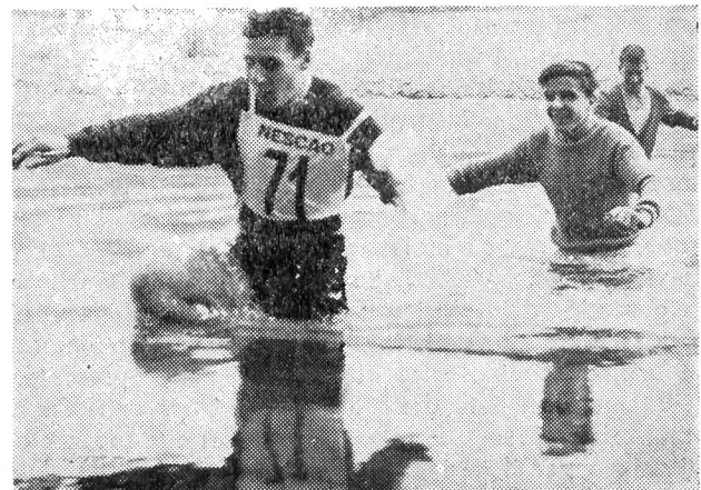
I famosi pattugliatori - nuotatori...

Cronometraggio con cronografi di precisione LONGINES Il NESCAO è il fortificante degli sportivi.