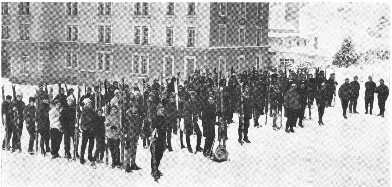
Ordine, disciplina, serietà: caratteristiche dei corsi cantonali sci dell'I.P. sempre più apprezzati, sempre più frequentati e ambito premio per i giovani ticinesi. Ecco i partecipanti al corso no° 34 ad Andermatt (10-15.2.1964), pronti per partire verso i campi di neve per le quotidiane esercitazioni.

Se la vista di tanti prati era uno spettacolo poco consolante per i nuovi arrivati, non era certo cosa da impressionare noi che conoscevamo le possibilità della regione e la decisione dei dirigenti dell'IP: «la neve non si abbassa — dicevamo ai dubbiosi — ebbene, ci alzeremo noi!» E così il rosso trenino dell'Oberalp, con gli assalti rumorosi e pollicromi a ogni stazione, aggiunse una nota di colore e di allegria alle imprese della settimana.