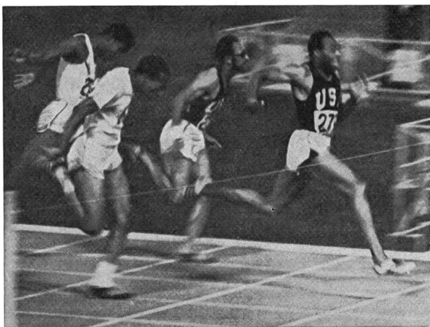
Solo neri nella finale-record dei 100 m. Jim Hines (USA) eguaglia il primato mondiale (9,9), davanti a Lennox Miller (Giamaica) e al suo compatriota Charlie Green.