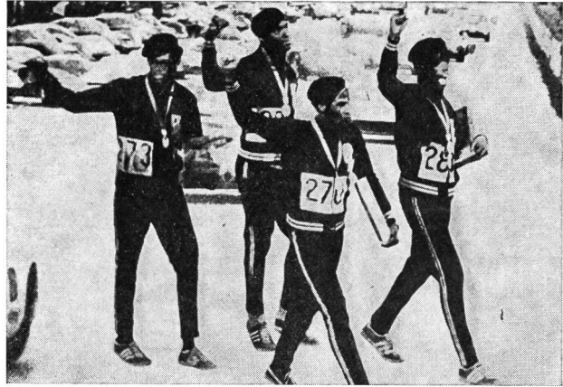
Medaglie che danno del peso ai pugni levati contro certe forme d'oppressione politica.

quando Roger Bannister, dopo aver corso per la prima volta nella storia dell'atletismo i mille metri in meno di quattro minuti, venne inviato dal suo governo in «tournée» pubblicitaria attraverso gli Stati Uniti; ed infine ancora allorchè i visti vengono rifiutati agli sportivi che desiderano passare da un blocco politico all'altro, le due Germanie rifiutano di battersi all'ombra della stessa bandiera, il pugno levato dei Negri americani minaccia la bandiera stellata, il Presidente De Gaulle conferisce la Legion d'Onore ai vincitori olimpionici della sua nazione!