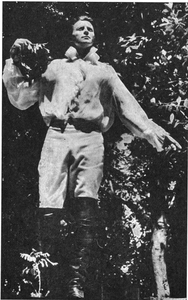
L'attore, ossia «colui che fa rivivere personaggi d'altri tempi».

ventura vissuta, le cui fasi inattese sono molto vicine a quelle scene improvvisate che costituirono il fascino e l'interesse della Commedia dell'Arte. Tuttavia, ad esclusione del catch, che sta allo sport come la farsa più volgare al teatro, la gaiezza è quasi totalmente esclusa dalla competizione. La maniera rude con la quale lo sport viene praticato, le tensioni esasperate che esso provoca (per esempio al traguardo delle corse), le ingiustizie e gli errori (imputabili ad un giocatore, a un giudice, ad un arbitro), gli incidenti e gl'imponderabili (slogature, lussazioni, contratture muscolari, cadute, strappi) che esso cagiona possono soprattutto apparentarlo alla tragicommedia classica, alla quale esso sport sembra legato dall'imperiosa regola delle tre unità: unità d'azione (una sola azione principale), unità di tempo (una durata regolamentare — in ogni caso limitata nel tempo), unità di luogo (in quanto l'azione si svolge in uno stesso edificio o su di uno stesso itinerario nettamente definito e controllato). Indubbiamente, talvolta, qualche intermezzo tragico o comico s'aggiunge alle peripezie della prova sportiva, anche se il fatto non è molto frequente. Inoltre, come avviene nella maggior parte dei lavori teatrali, dei film e ... dei romanzi, alla fin fine, i migliori finiscono per trionfare.