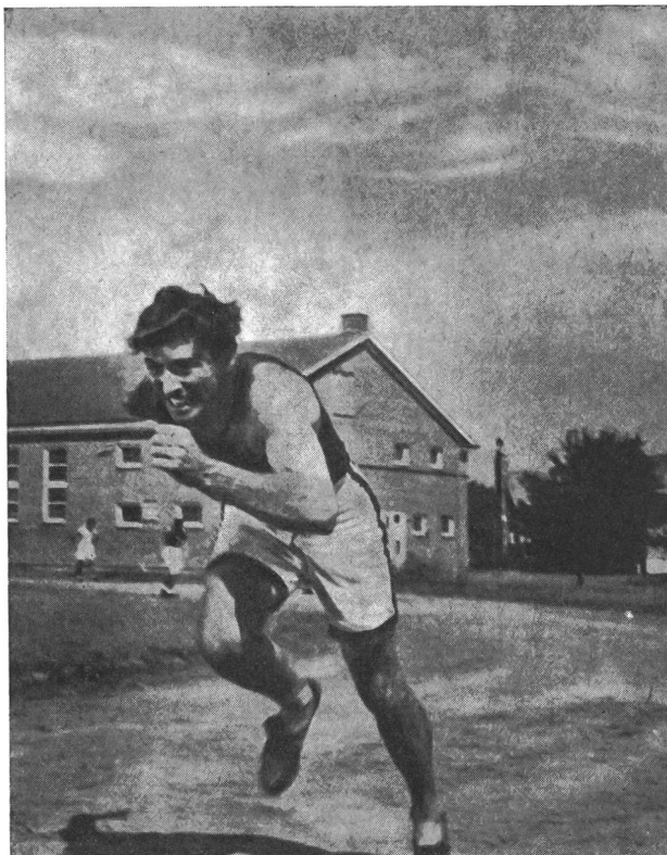
Burt Lancaster in «Il Cavaliere dello Stadio», con una partenza impeccabile. Solo lui poteva interpretare, in modo così verosimile, la parte di Jim Thorpe.

Il danese Ritter sarebbe quindi stato incapace, alla fine del suo «monologo» al Velodromo olimpionico di Città del