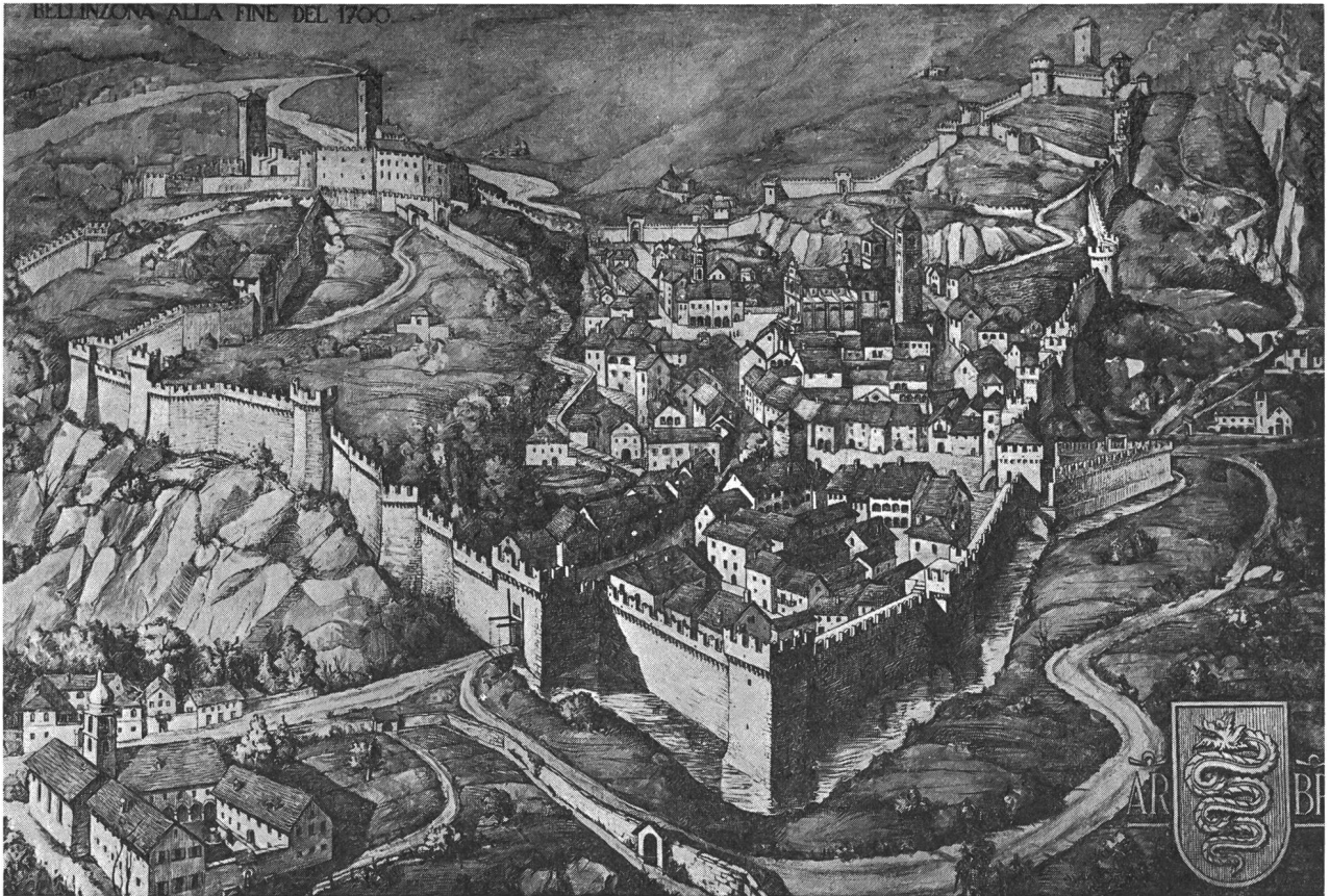
Bellinzona alla fine del 1700