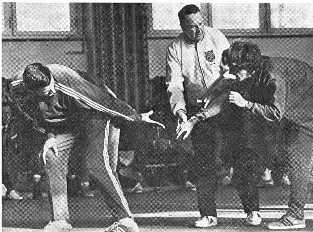
Bud Winter conosce la sua materia nei più piccoli dettagli . . . . .

Infine, e ciò è molto importante, nel periodo competitivo l'allenamento perde gran parte della sua intensità; al contrario gli scattisti di Winter partecipano ad una gara ogni volta che possono e non disdegnano neppure d'isciversi, nella stessa competizione, su varie distanze e spesso volte con eliminatorie. Dato che sono stati abituati durante la loro preparazione a subire una volta alla settimana dei test di prestazione, la competizione per loro si colloca a un livello superiore ma non per la qualità dello sforzo bensì soltanto nelle sue finalità.