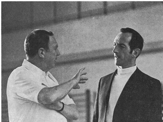
Bud Winter in discussione con M. Hiemeyer, maestro di sport presso l'università di Zurigo

Bud Winter nella sua esposizione ha insistito su numerosi punti che sembrano in contraddizione con i concetti europei di preparazione alla corsa ed alla resistenza. Fra essi è da rilevare in primo luogo la ricerca della forma ottimale proiettandola su tutta la stagione competitiva, così come fa Zatopek. Il campione cecoslovacco afferma infatti di trovarsi in forma competitiva dodici mesi su dodici e che non c'è alcuna ragione per sostenere il contrario, alle condizioni naturalmente di non rimanere colpito da malattia o da