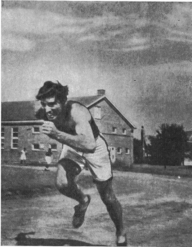
Burt Lancaster in «Il cavaliere dello stadio», in una impeccabile partenza. Solo lui poteva interpretare in modo così veritiero il ruolo di Jim Thorpe.

Michael Redgrave incarnavano i due eroi del racconto, molto insipido, e che si basa su di un postulato contestabile e sportivamente falso . Collin (interpretato da Tom Courtenay) ospite di una casa di correzione posta sotto controllo, partecipa ad un «cross» con i colori della sua casa di pena. Egli è il migliore della squadra; deve vincere e, in effetti, giunge in vista della banderuola del traguardo, quando, egli si ferma a qualche metro dalla linea e si lascia volontariamente sorpassare allo scopo di gettare nella costernazione il direttore dello stabilimento di pena il quale crede nelle virtù redentrici dello sport. Il prigioniero Collin crede così d'essersi vendicato delle vessazioni subite sin dalla sua incarcerazione.