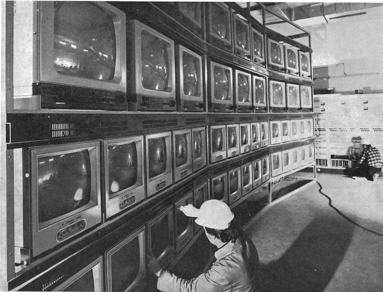
Circa un miliardo di persone in tutto il mondo ha seguito i Giochi Olimpici tramite la televisione. Nella foto, la sala centrale di comando dell'enorme centro televisivo. In questo centro TV di Monaco sono confluite tutte le registrazioni di tutte le competizioni sportive per essere poi ritrasmesse per i programmi delle singole nazioni. Gran parte dei programmi è stata trasmessa direttamente; le manifestazioni avvenute contemporaneamente sono state memorizzate in 60 registratori d'immagini. È stato possibile trasmettere contemporaneamente fino a 12 programmi e 60 telecronache diversi.

E fortuna e sfortuna sono veramente state della partita. L'acqua è un elemento indomabile, che non tiene conto del principio secondo il quale ogni concorrente dovrebbe profittare delle medesime condizioni. Può infatti sembrare ingiusto che le onde si formino o scompaiano e che le correnti si modifichino davanti a questa o a quella porta. Ne risulta ad ogni modo un aspetto ben più vivente, imponderabile e talvolta fatale, che conferisce alla competizione un carattere profondamente umano.