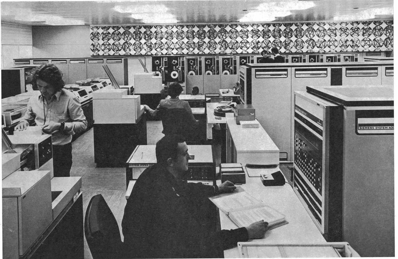
Il calcolatore olimpico. Durante i Giochi, son giunti a questo centro di calcolo tutti i dati relativi a tutte le competizioni, che si sono svolte in 31 luoghi diversi. Il calcolatore ha ordinato questi dati in brevissimo tempo, per ritrasmetterli, mediante telescriventi, a tutti i centri-stampa dislocati tra Monaco e Kiel. L'elaboratore non ha trasmesso automaticamente solo il piazzamento dei concorrenti, ma ha anche segnalato la qualificazione eventuale degli atleti per la prova successiva, preparato un grafico per gli accoppiamenti negli incontri di pugilato, judo, lotta, scherma, ecc., ed emesso un segnale speciale ogni volta che è stato stabilito un nuovo primato olimpico o mondiale.